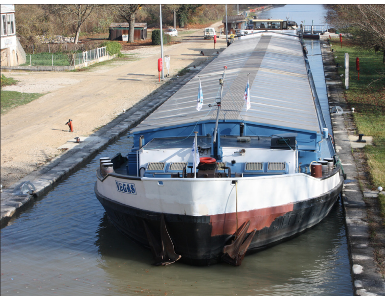
© François Brunet/Service communication ville de Nogent-sur-Seine

Montant des travaux : 5,990 millions d'euros Source : http://www.port-de-laube.com